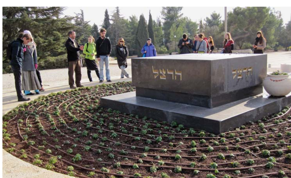
► U HROBU ZAKLADATELE SIONISMU

My však už míříme na Machane Jehuda. Studenti se prodírají davem mezi hromadami ovoce, zeleniny, koření a pečiva. Z postranní uličky zavane charakteristická vůně ryb. Procházka trhem v pátek odpoledne je nezapomenutelný zážitek. Lidé pobíhají a snaží se na poslední chvíli dokoupit vše potřebné na šábes. Nás také čeká poklidný den odpočinku, provoněný dobrým jídlem a sefardskými zpěvy. Všichni se potřebujeme vyspat. Po havdalah pak vyrážíme na hlavní jeruzalémskou ulici Ben Jehuda. Kavárna Tmol šilšom je stále malebným místem, kam se dá schovat před lidmi.