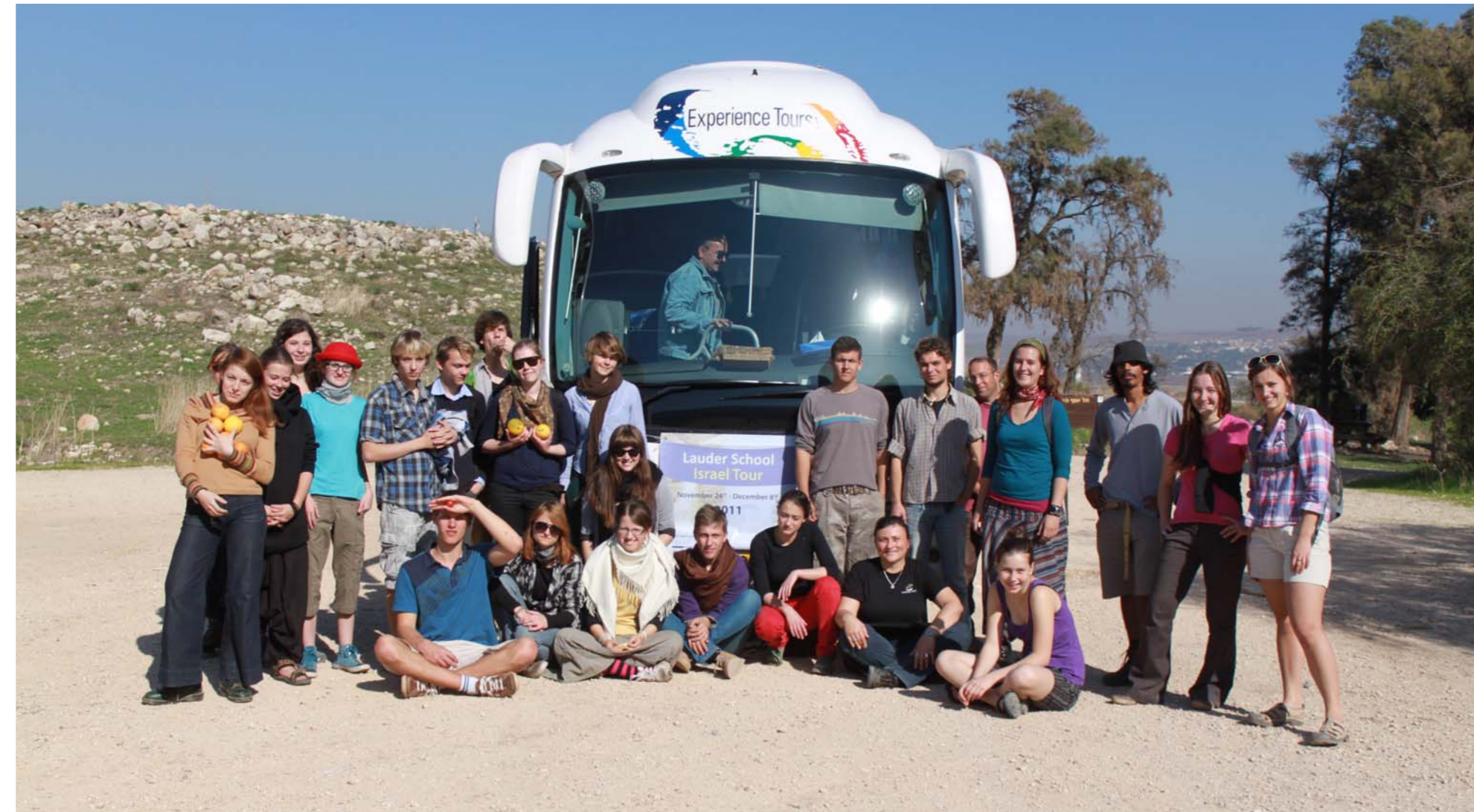
► SPOLEČNÉ FOTO PO SESTUPU Z POHOŘÍ GILBOA

Ráno rovnáme sbalené kufry do autobusu a vyrážíme na cestu. Ještě zaskočíme na Givat Hatachmošet pro ztracený telefon. Již druhý ztra-