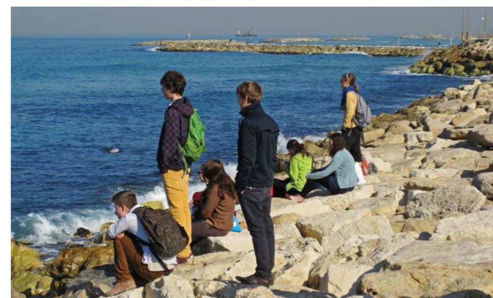
► POHLED NA MOŘE V TEL AVIVU

V podvečer přijíždíme do Tel Avivu. V Hechal haacmaut nás čeká nadšená průvodkyně. Velkými slovy i gesty nám přibližuje okolnosti vyhlášení