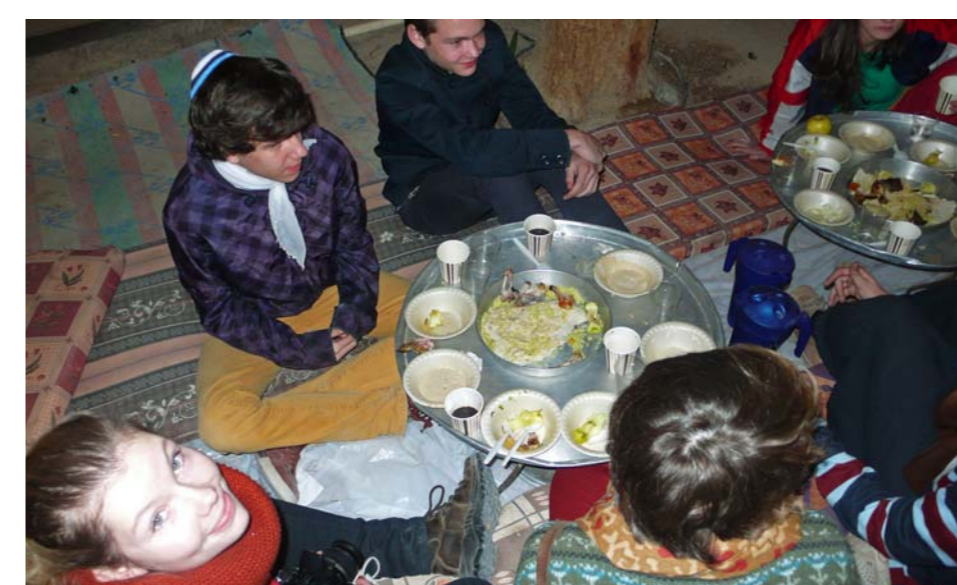
► NA VEČEŘI U BEDUÍNŮ

Páteční ráno má vážnější atmosféru. Jdeme navštívit domov seniorů v Tiberias. Staroušci mají zrovna kabalat šabat. Zpočátku panuje dost rozpačitá atmosféra. Posléze ale studenti berou iniciativu do svých rukou, tančí a zpívají. Po návštěvě místního hřbitova a nákupu v Tiberias nás čeká zasloužený odpočinek. V hostelu se koná bar micva. Stále je nádherné počasí.