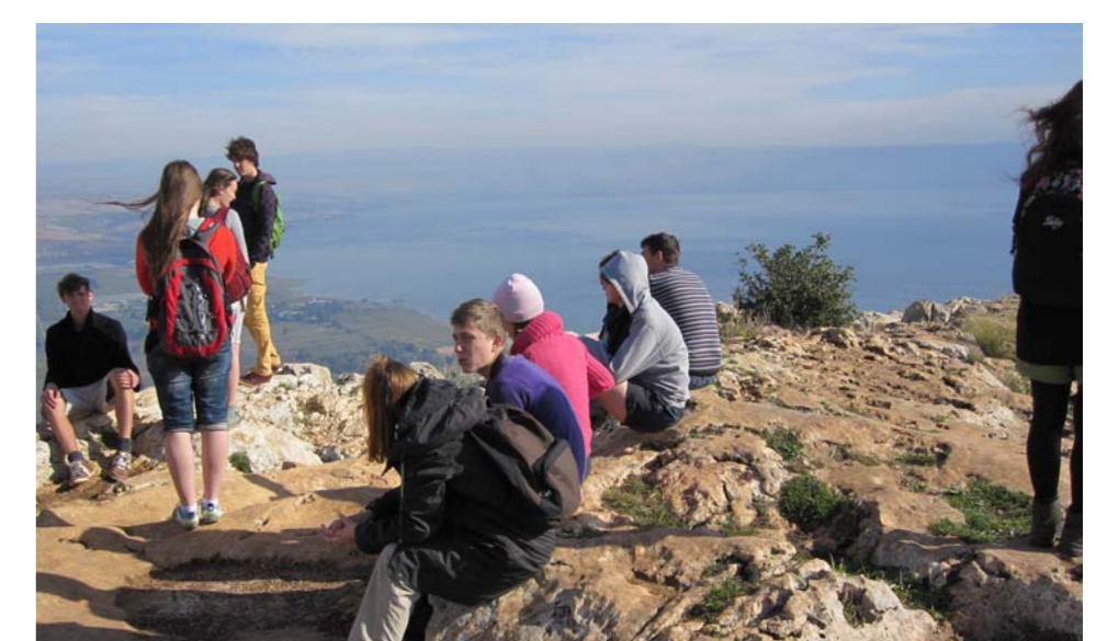
► POHLED Z HAR ARBEL

V pohoří Gilboa podle pověsti dodnes bloudí Šaulův duch. Prochází kolem nás na cestě dolů do údolí, když nám Jamie poutavě vypráví příběh jeho posledních dní. Cestou k autobusu opět mjíme pomerančový háj. Čas se pomalu krátí.